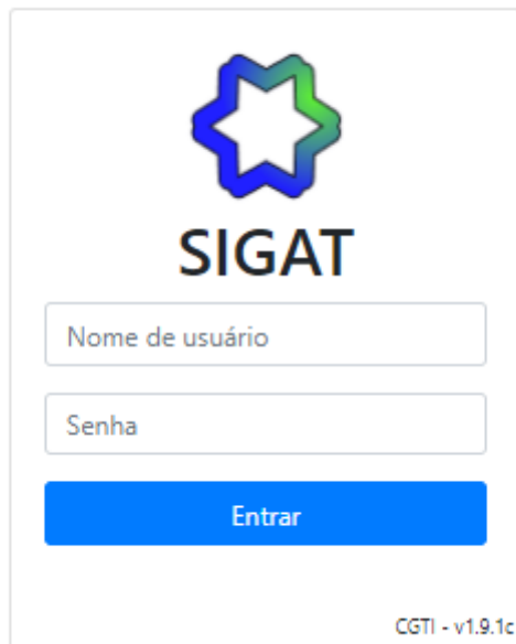
Figura 1 - Login no sistema

Na página de login será preciso inserir o seu nome de usuário e senha conforme os registros do Active Directory, para depois clicar no botão de entrar.