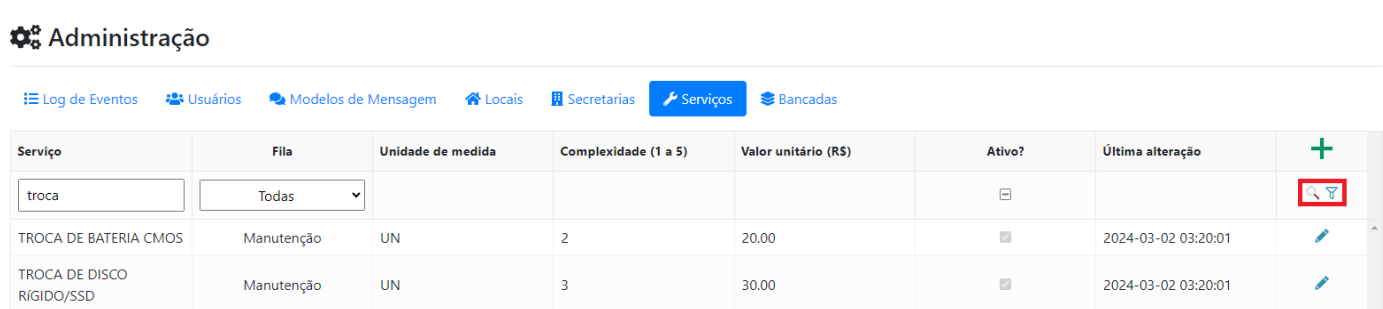
Figura 5 - Pesquisa de serviço

Clique no ícone ao lado da lupa para limpar o filtro de pesquisa.