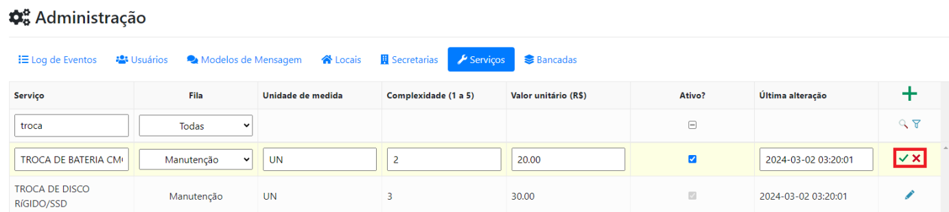
Figura 6 - Edição de serviço

Para alterar as configurações de um serviço, clique no ícone de edição (lápis) localizado na direita do serviço que deverá ser editado ou simplesmente clique em qualquer local na linha do serviço, e em seguida altere os campos desejados. Neste momento também é possível desativar ou ativar um serviço, porém não é possível remover um serviço do sistema. As alterações podem ser confirmadas ou canceladas pelos botões localizados na direita do serviço sendo editado.