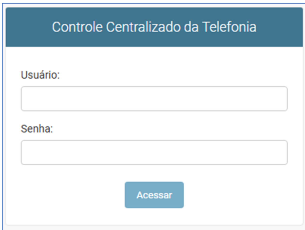
Figura 1 - Tela de Login do sistema Controle Centralizado da Telefonia

Ao acessar, será exibida a seguinte tela para realização do login: