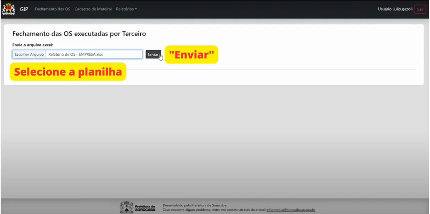
IMAGEM 2. SELECIONE AS OS